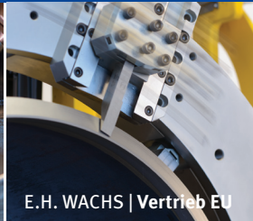
E.H. WACHS | Vertrieb EU

Orbitalum Tools ist Teil der ITW ORBITAL CUTTING & WELDING Gruppe innerhalb des US-amerikanischen Industriekonzerns Illinois Tool Works Inc. (ITW) mit weltweit ca. 60.000 Mitarbeitern. Als führender Anbieter von Rohrtrenn-/Anfas- und Orbitalschweißmaschinen entwickelt und produziert Orbitalum in Singen Lösungen für den weltweiten industriellen Rohrleitungs- und Apparatebau.