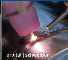
orbital | schweißen