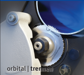
orbital | trennen